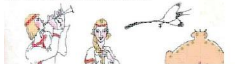
Волк и семеро козлят