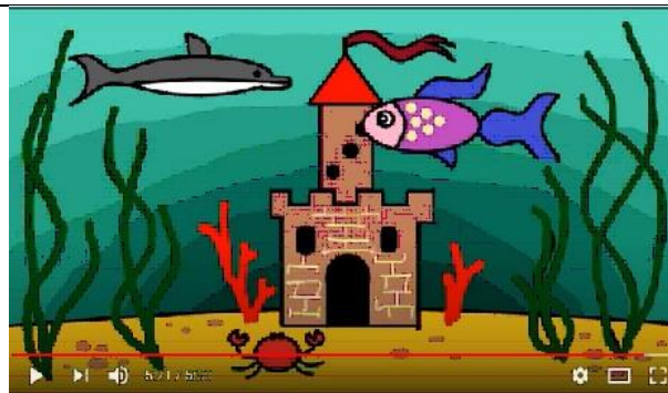
Сказочная страна (ИЗО, 1 класс)

Панно можно выполнить из пластилина и поместить в рамочку. Например